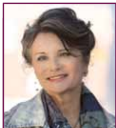
Hedi Wechner Bürgermeisterin der Stadt Wörgl

Hedi Wechner , Bürgermeisterin der Stadt Wörgl